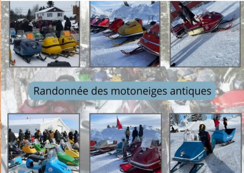
Randonnée des motoneiges antiques

🍷* Un souper méchoui en excellente compagnie, au profit d'une bonne cause.